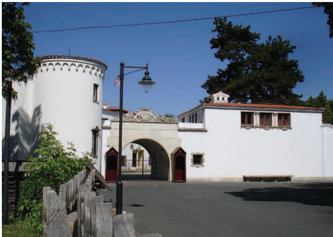
A bukaresti Erzsébet-palota, a királyi család székhelye

– A politikai elitből kiábrándultak arra a következtetésre jutottak, hogy kell egyszemélyi központ, és ezt a király személye testesíthetné meg. A magyarok szempontjából teljesen mindegy, hogy ki lesz a király, az uralkodó úgyis a románok királya lesz, és ha meg akar maradni hosszú távon ebben az országban, akkor azt a fajta politikai vonalat kell követnie, amely az egységes román nemzetállamot támogatja, s ebben van egy kivételesen nemzet, egy uralkodó nemzeti egyház, meg léteznek nemzetiségek, amelyeknek papíron egyenlő jogaik vannak, de a gyakorlat 1918 után mást igazolt. A magyarok számára „nem jó még egy Mátyás király”, és Romániából sem lesz egyhamar mézeskalács ország.