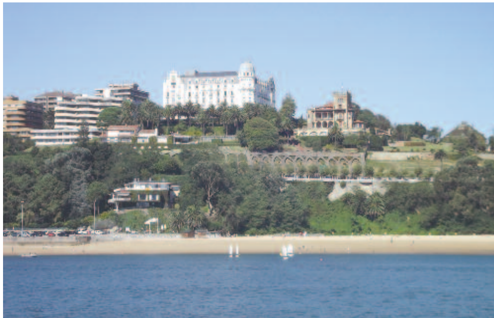
Santander ötcsillagos szállója a sétahajóról fényképezve