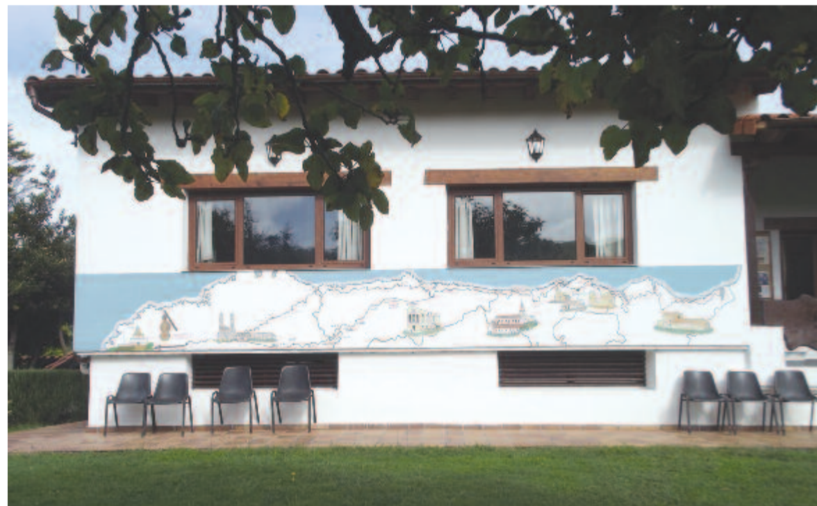
A Camino del Norte vázlatos térképe

kat árulnak. Valami harminc zárandoknak tudnak szállást adni, este egyszerű, de laktató egytálételt, reggel pedig teát, kenyeret, citromos almalekvárt adtak az egy éjszakára betérő szállóvendégeknek.