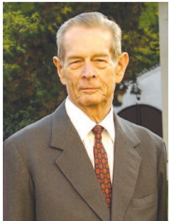
I. Mihály király

Azt lehet mondani, hogy Mihály királynak hatalom nélküli emberként voltak ugyan intézkedései, amelyeket nevében hoztak, de nem biztos, hogy ő ezekkel egyet is értett. Ha Erdélyben járt, akkor is az erdélyi románok vették körül. Volt egy kastélyuk Soborsinban (Arad megye), amelyet apja 1937-ben vásárolt. Innen gyakran jártak Kolozsvárra. Ennyi. A kisebbségvédelem nem tartozott a király feladatai közé, bár ő volt a kisebbségek