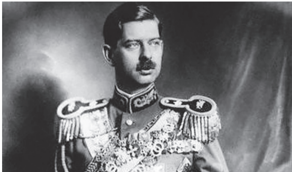
II. Károly, Mihály édesapja

és Dél-Erdélyre. Ez II. Károly bukásához, ill. Antonescu katonai diktatúrájához vezetett. Észak-Erdélyben magyar katonai közigazgatást szerveztek. Mindkét ország a németek oldalán belépett a második világháborúba. A román és a magyar katonákat a keleti frontra vezényelték. A magyarok elvérezték a II. ukrán fronton (a Don-kanyarban), a románok pedig Sztálingrádnál. Ebben az időszakban Mihály király gyakorlatilag nem uralkodott. A vereséget kihasználva, a hadsereg támogatásával, Emil Bodnăraș tábornok (később az RKP Központi Bizottságának tagja) vezetésével Mihály király megszervezi az 1944. augusztus 23-i puccsot, amelynek következményeként Antonescut letartóztatják. A hadsereg vezetői bevonják az államcsínybe a Gheorghe Gheorghiu Dej vezette kommunistákat is. Horthynak is lehetősége lett volna kiugorni, de ő nem volt hajlandó szövetkezni a baloldallal, inkább megvárta a nyilas puccsot. Ebből az következett, hogy 1944. augusztus 23-a után Romániát úgy kezelték, mint kedvezményezett hadviselő felet, és a későbbi béketárgyalásokon elérték azt, hogy Besszarábia és Bukovina kivételével, amelyekre a Szovjetunió igényt tartott, az 1938-as határokat állítsák vissza. Mihály király megkapta a Szovjetunió Hőse címet, amiért átállt a szövetségesek oldalára.