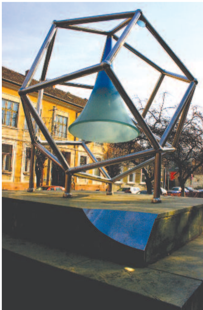
Téli ég harangjának fénynyelve csillan