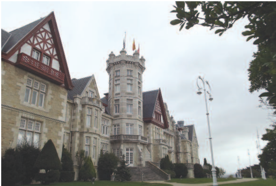
Santander, a királyi kastély

A cisztercita szerzetesek – az ősi monasztikus eszményeket keresve – a világtól való elszakadást, a kétkezi munka fontosságát hirdetik, szegénységet és szigorú aszkézist fogadnak. Az egyik udvari épületben berendezett üzletben a saját maguk által gyártott lekvárokat, „kézműves” sört meg kegytárgya-